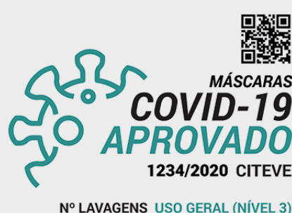
Imagem exemplificativa do selo de aprovação